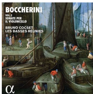
Boccherini (vol. 2) : Sonate per il violoncello – Bruno Cocset & Les Basses Réunies