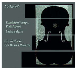
Evaristo & Joseph Dall'Abaco : Capricci & sonate per violoncello