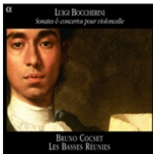
Boccherini : Sonates & concertos – Bruno Cocset & Les Basses Réunies